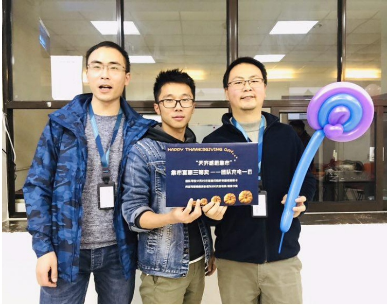
(Happy Hour 活动)