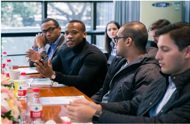
（天齐开放日——清华大学苏世民书院参访）

天齐锂业在发展过程中，注重社区建设与交流，关注社区需求。我们深入生产基地所在社区，与辖区内居民及消防队等利益相关方开展互动，力求与业务所在地社区共同发展，携手构建和谐美好社区。在报告期内，我们举办“天齐开放日”活动，接待了来自清华大学苏世民书院、西南财经大学经管学院以及澳洲迪肯大学师生的参访，促进了企业与高校间的沟通交流。