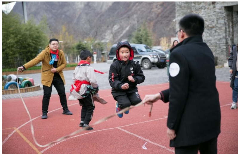
（“育善育德，让爱先行”志愿服务）