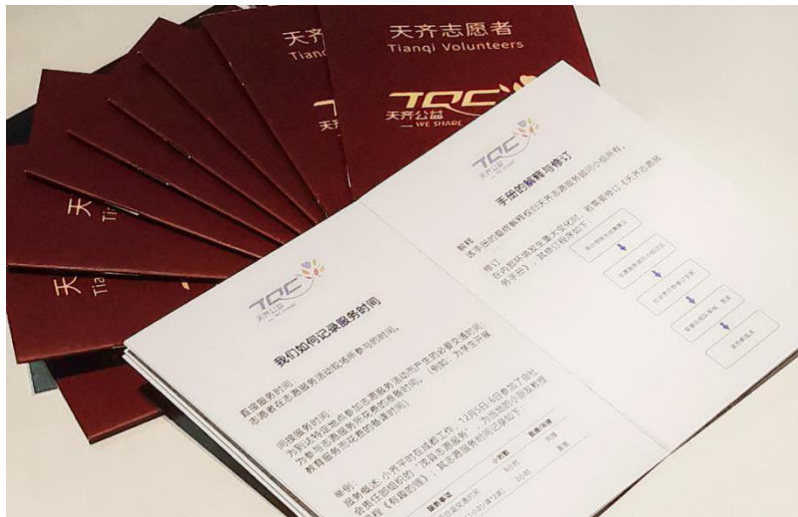
（《天齐志愿服务手册》）

除了公益捐赠外，我们也积极推动员工参与公益活动。2018 年我们成立了“天齐志愿者”团队，制定了《天齐志愿服务手册》，并在四川成都、遂宁射洪，江苏张家港、重庆铜梁四地同步开展首个主题为“育善育德，让爱先行”的志愿者服务，更好地履行企业社会责任。