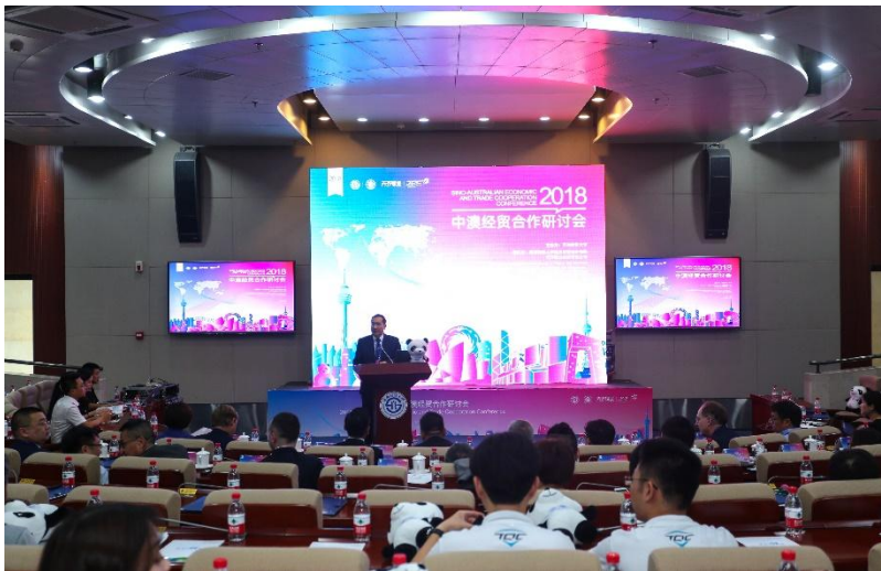
（第二届中澳校际经贸合作研讨会）