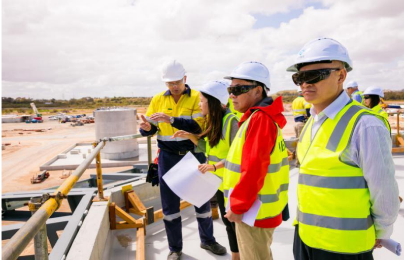
（投资者到生产基地进行现场参观）