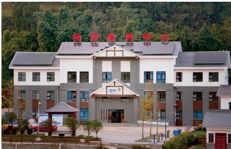
（已开诊的联村示范卫生室之一）

为系统性的改善、提高业务所在地社区的医疗水平，我们在 2016 年与遂宁市人民政府签订正式捐赠协议，在三年内分三期捐助开展遂宁市健康扶贫“三大工程”。2017 年第一期项目已按照计划顺利实施，2018 年第二期项目主要包括：修建 10 个联村示范卫生室，完成选址工作，并陆续开工建设及投入使用；组织委派医疗专家深入开展“一对一”、“人对人”的支医活动，确保支医工作每月至少开展一次；组织遂宁市贫困村和首批联村卫生室的上百名医生参加包括专业理论、实践技能和临床相关知识的全脱产培训课程。