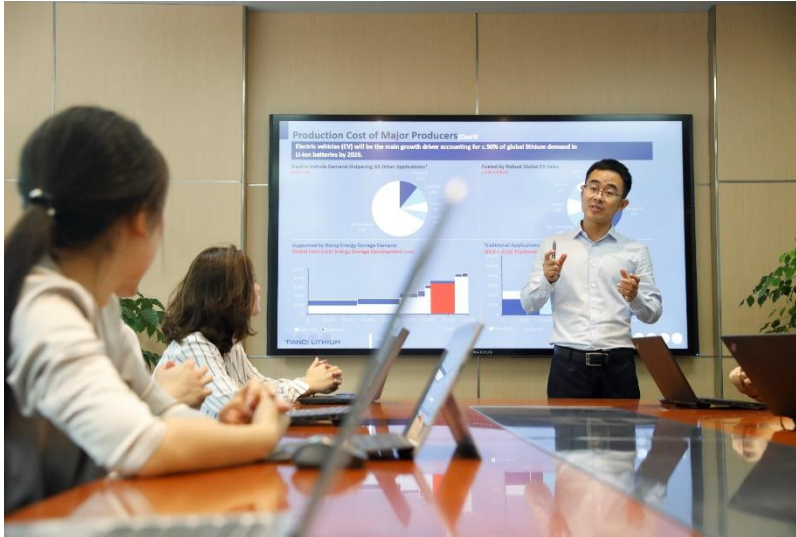
（开展员工业务技能培训）