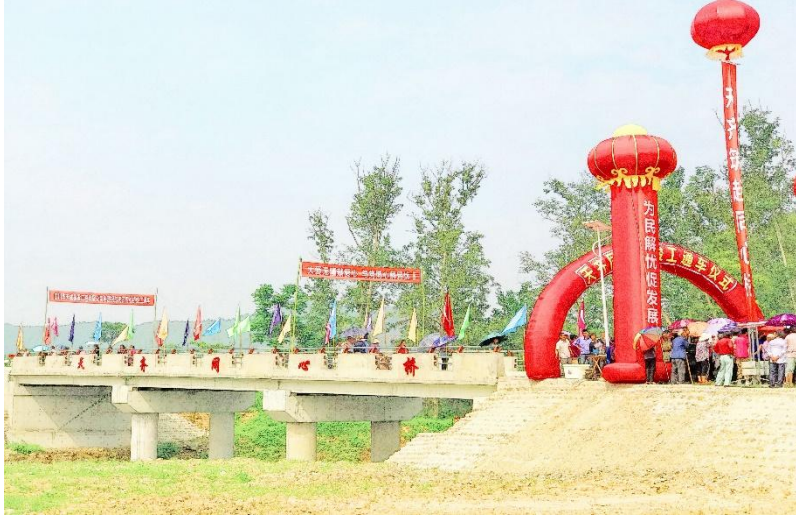
(2018年5月31日天齐同心桥竣工通车仪式)