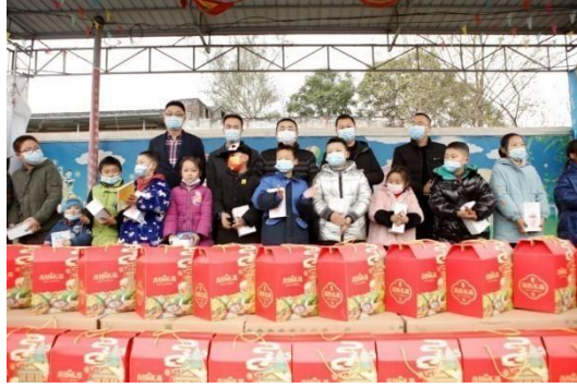
天齐锂业为留守儿童送上暖冬物资