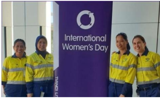
国际妇女节 iWomen 项目