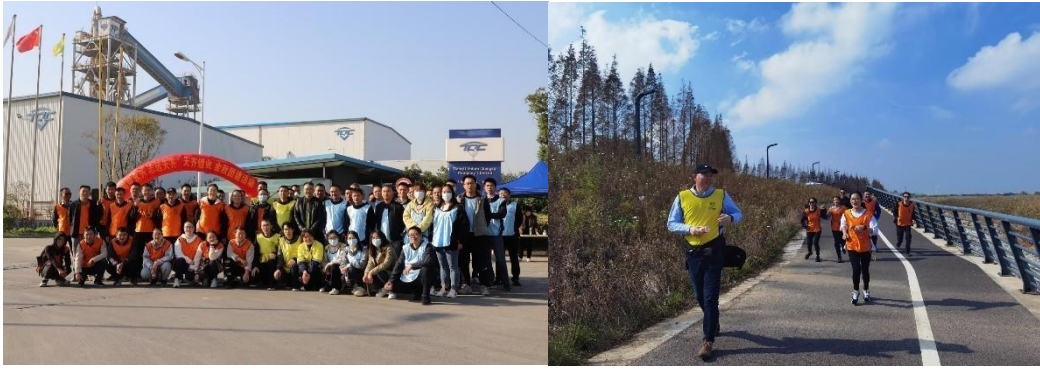
“江湾健步行”团队建设活动