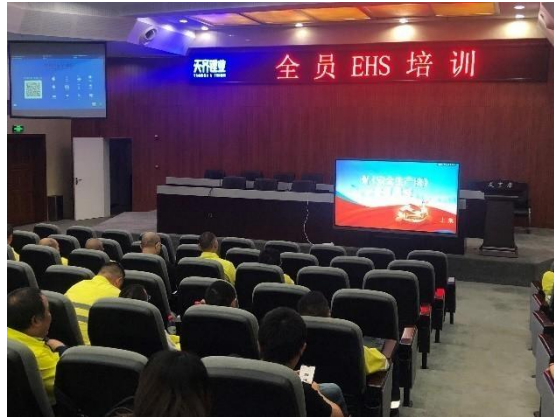
全员 EHS 培训

管理资格培训考试，全面提升全员职业健康安全意识，提高管理人员职业健康安全管理能力。