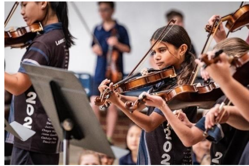
西澳大利亚交响乐团发展项目