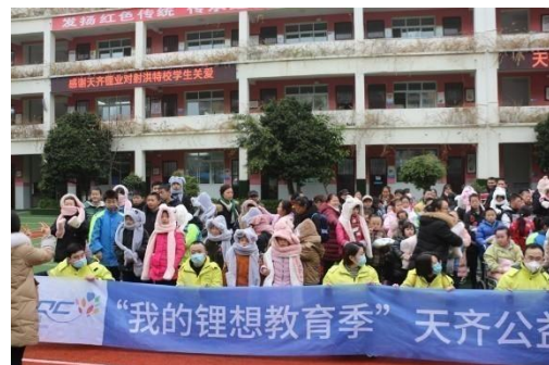
关爱特殊儿童志愿服务