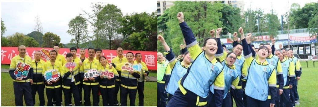
“齐心协力 共创未来”主题团建活动